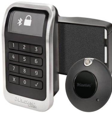
3681 Serrure électronique intégrée pour casiers avec Clé Fob Bluetooth. Modèle adapté aux personnes à mobilité réduite (conforme aux normes ADA).