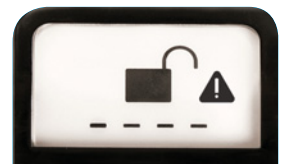
Alerte blocage du mécanisme