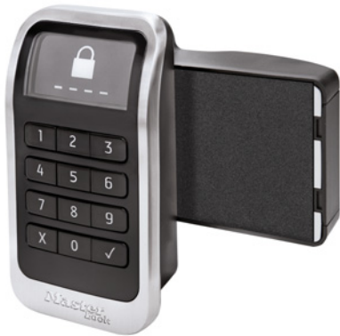
3685 Serrure électronique intégrée pour casiers

La serrure électronique intégrée pour casiers Master Lock offre un degré d'innovation supérieur grâce à un écran haute visibilité pour une utilisation intuitive, une pile à longue durée de vie pour réduire les coûts d'exploitation et un système antiblocage du système de verrouillage.